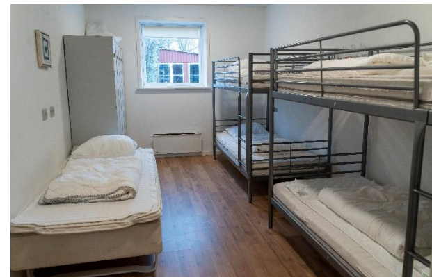
Blick in einen der insgesamt zehn Schlafräume.