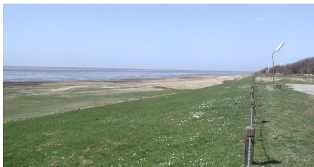
Die „Waterkant“ ist nur gut 500 m von der Unterkunft entfernt.

Dann geben Sie den beiliegenden Anmeldeabschnitt ausgefüllt und unterschrieben bitte bis spätestens zum 31. März 2020 bei einem der Seelsorger oder im Pfarrbüro ab!