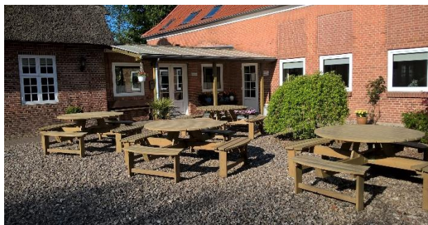
Schöner mit Kies bedeckter Innenhof mit Picknickbänken. Für Sport und Spiel gibt es eine Spielwiese mit kleinen Fußballtoren und einen Basketballkorb, abends sitzt man um die Feuerstelle.