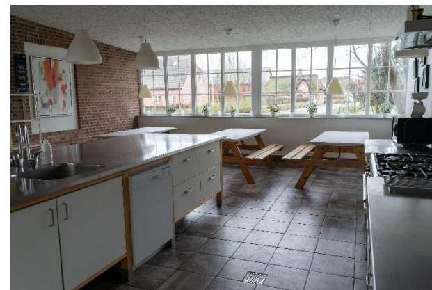
Durch die Küche gelangt man auf die große, überdachte Terrasse mit Gartenmöbeln.