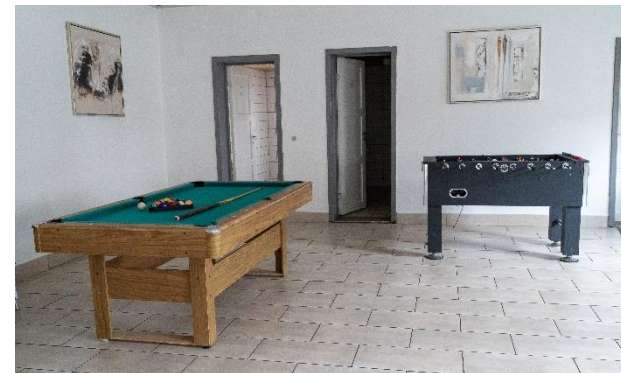
Sollte es einmal regnen, bieten die Räumlichkeiten im Haus genügend Abwechslung.